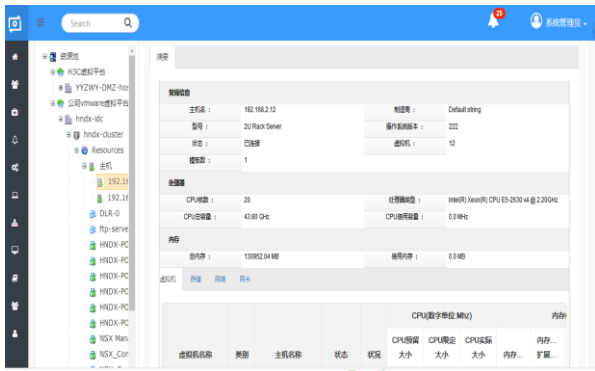
图三：异构云资源池对接资源自动发现 (CMBD)